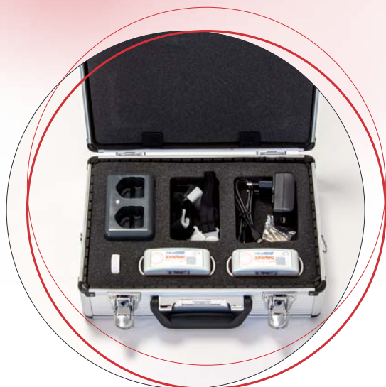
Vibramoov TM pour CPM Kinetec ® (genou et hanche)